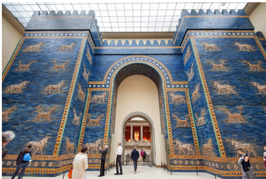
Museu Pergamon, Berlin.