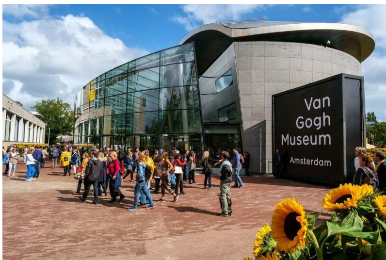
Museu Van Gogh, Amsterdam.

O Rijksmuseum, o MoMA, o Musée d'Orsay ou o museu de Van Gogh são alguns deles. É uma boa forma de aproveitar o isolamento.