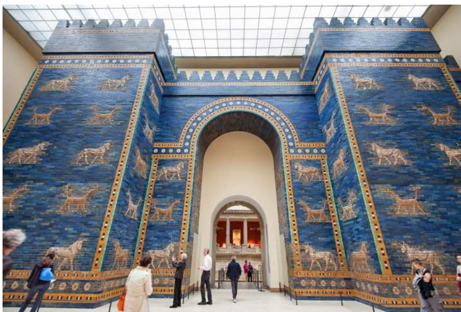
Museu Pergamon, Berlin.