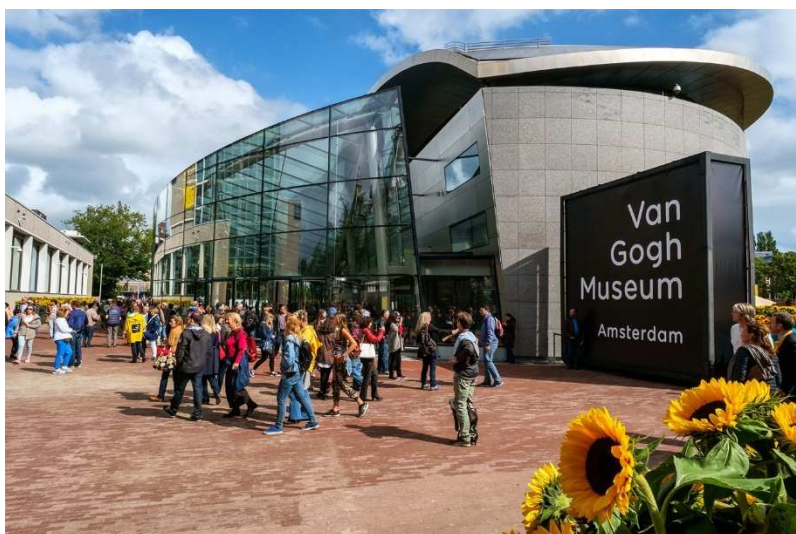
Museu Van Gogh, Amsterdam.

O Rijksmuseum, o MoMA, o Musée d'Orsay ou o museu de Van Gogh são alguns deles. É uma boa forma de aproveitar o isolamento.