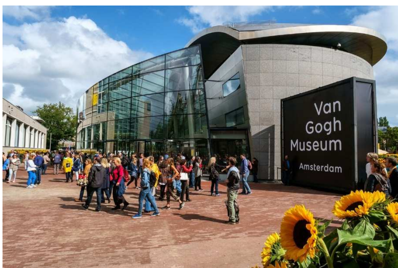
Museu Van Gogh, Amsterdam.

O Rijksmuseum, o MoMA, o Musée d'Orsay ou o museu de Van Gogh são alguns deles. É uma boa forma de aproveitar o isolamento.