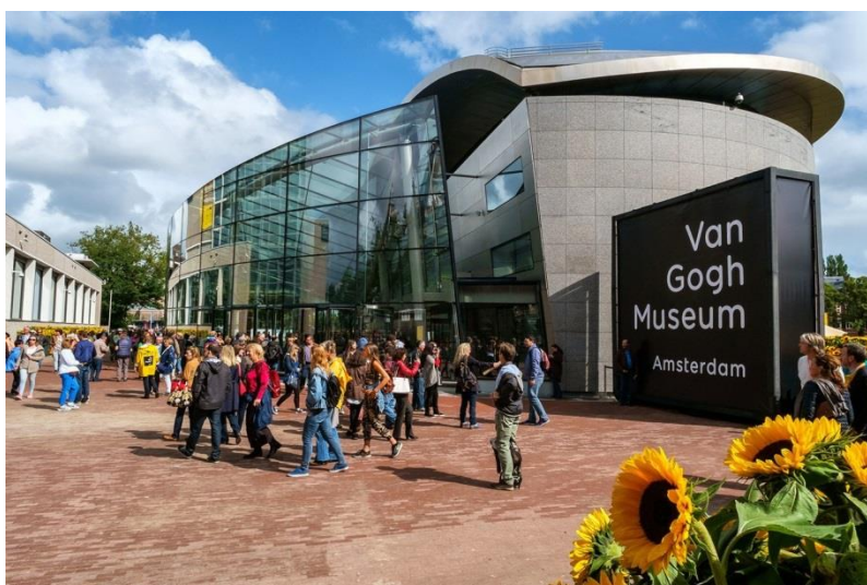
Museu Van Gogh, Amsterdam.

O Rijksmuseum, o MoMA, o Musée d'Orsay ou o museu de Van Gogh são alguns deles. É uma boa forma de aproveitar o isolamento.