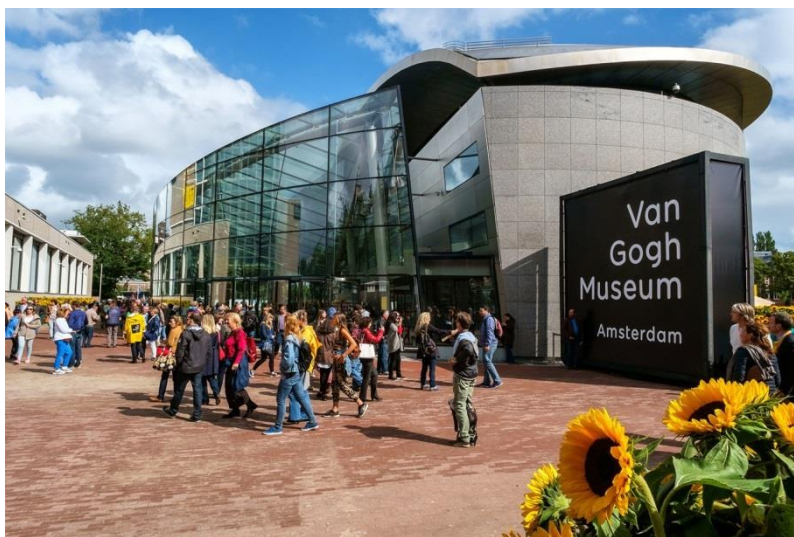
Museu Van Gogh, Amsterdam.

O Rijksmuseum, o MoMA, o Musée d'Orsay ou o museu de Van Gogh são alguns deles. É uma boa forma de aproveitar o isolamento.