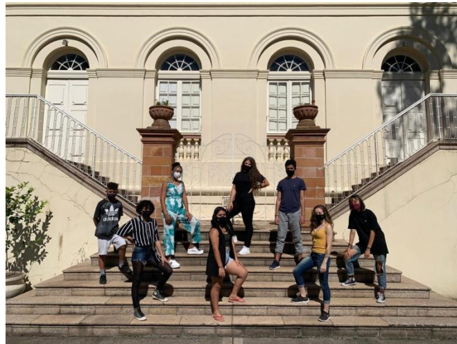
Integrantes da Sol Maior no Theatro São Pedro