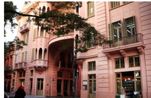
Fachadas do Museu Histórico Farroupilha e da Casa de Cultura Mario Quintana