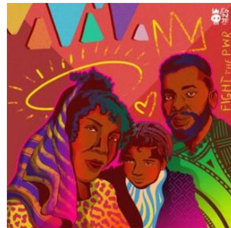
Projeto "Retratos de Artistas Independentes em Tempos de Pandemia", de Pablo Conde