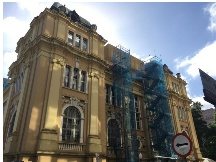
Fachada do Margs, em reforma

A reforma está sob supervisão do Iphan e do Iphae.