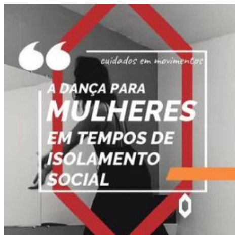
Projeto “A dança para mulheres em tempos de isolamento social”, de Marcella Rodrigues