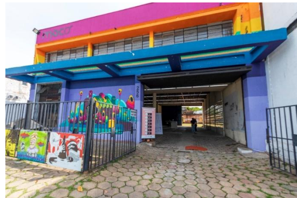
Fachada da nova sede do MACRS

Dois bondes elétricos da Carris foram doados pela Polícia Civil ao MACRS. Um será restaurado para visitação, em seu estado original, e o outro será usado como espaço educativo.