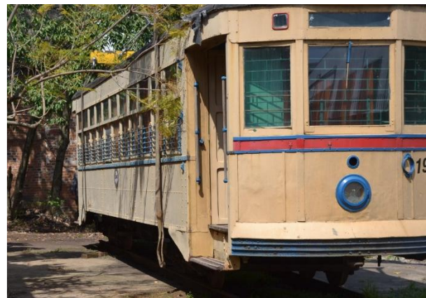
Bondes históricos estão no 4º Distrito