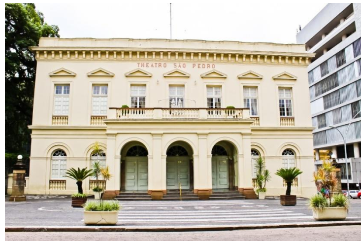
Fachada do Theatro São Pedro

O teatro também transmitiu virtualmente o projeto Mistura Fina. Programação gratuita, incluindo dança, música popular e erudita, além de lives e de diferentes shows.