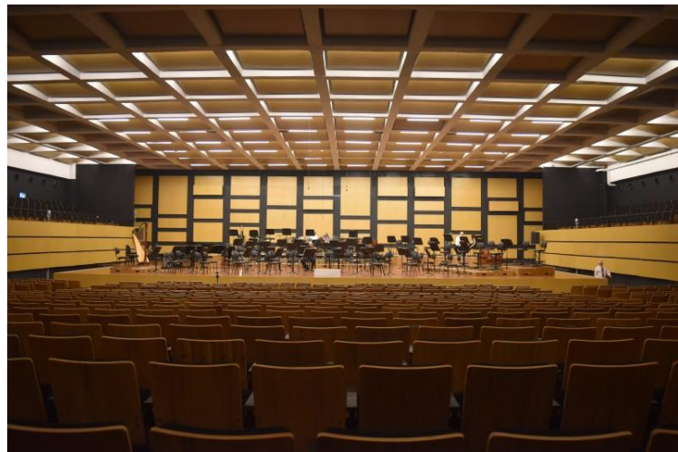
Casa da Ospa

A Fundação Ospa venceu o edital do Fundo para Reconstituição de Bens Lesados (FRBL), do Ministério Público do Rio Grande do Sul (MPRS), e garantiu o valor de R$ 4,69 milhões para a finalização do complexo Casa da Ospa e para a realização do programa Ospa Social.