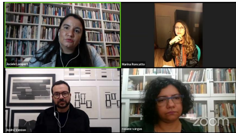
Atividade “Narrativas abrangentes e diversidade na Arte Contemporânea recente”, do Museu de Arte Contemporânea do Rio Grande do Sul (MACRS)