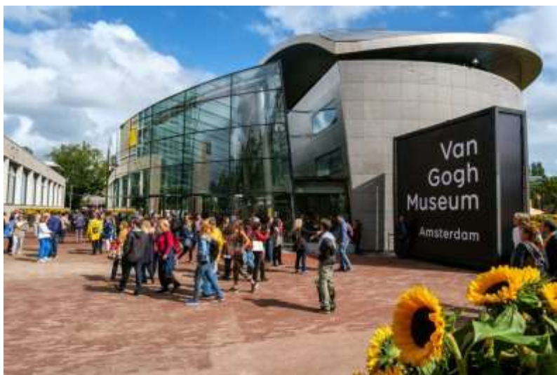
Museu Van Gogh, Amsterdam.

O Rijksmuseum, o MoMA, o Musée d'Orsay ou o museu de Van Gogh são alguns deles. É uma boa forma de aproveitar o isolamento.