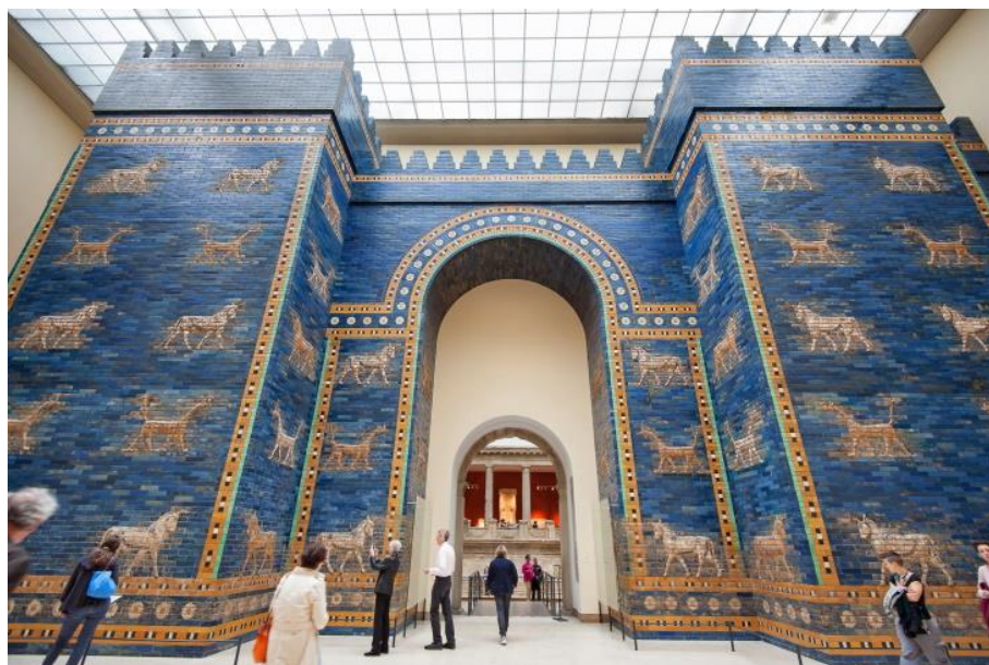
Museu Pergamon, Berlin.