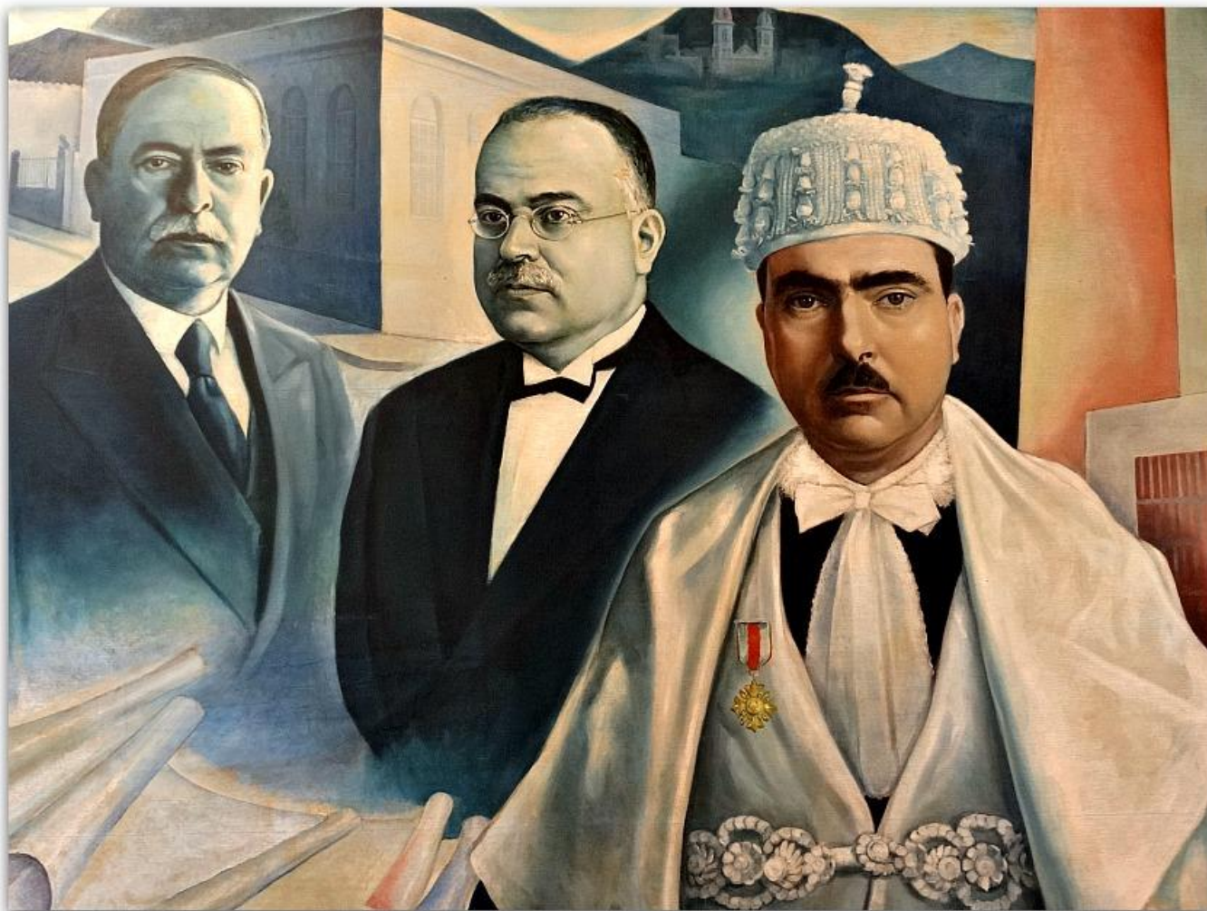
José Maria da Gama Lobo d'Eça, o Barão de Saicã

Assistam ao vídeo sobre o Museu Educativo Gama d'Eça produzido pela TV Campus-UFSM.