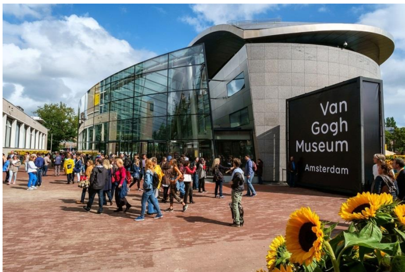
Museu Van Gogh, Amsterdam.

O Rijksmuseum, o MoMA, o Musée d'Orsay ou o museu de Van Gogh são alguns deles. É uma boa forma de aproveitar o isolamento.