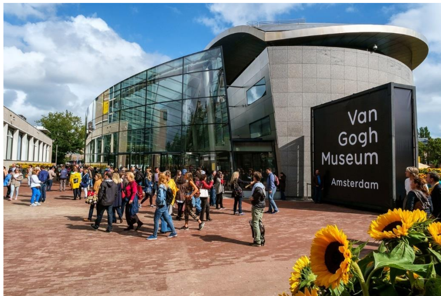
Museu Van Gogh, Amsterdam.

O Rijksmuseum, o MoMA, o Musée d’Orsay ou o museu de Van Gogh são alguns deles. É uma boa forma de aproveitar o isolamento.