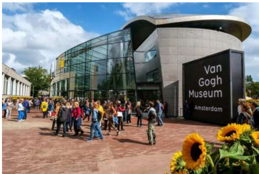
Museu Van Gogh, Amsterdam.

O Rijksmuseum, o MoMA, o Musée d'Orsay ou o museu de Van Gogh são alguns deles. É uma boa forma de aproveitar o isolamento.