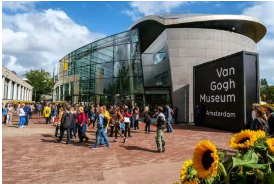
Museu Van Gogh, Amsterdam.

O Rijksmuseum, o MoMA, o Musée d'Orsay ou o museu de Van Gogh são alguns deles. É uma boa forma de aproveitar o isolamento.