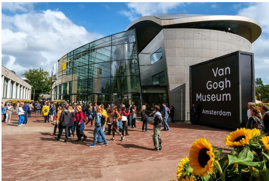
Museu Van Gogh, Amsterdam.

O Rijksmuseum, o MoMA, o Musée d'Orsay ou o museu de Van Gogh são alguns deles. É uma boa forma de aproveitar o isolamento.