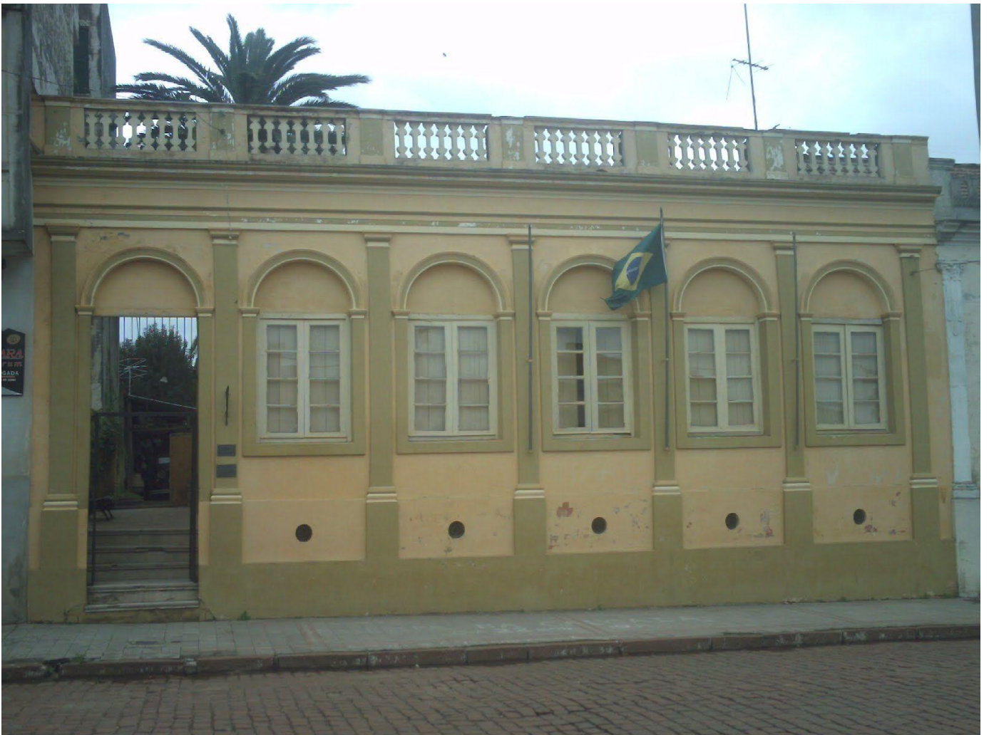
Museu Paulo Firpo