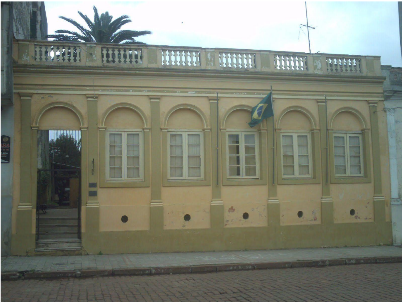
Museu Paulo Firpo

“Desde 1º de fevereiro, o museu de Dom Pedrito está apresentando “ARTEFATOS INDÍGENAS NA COLEÇÃO SEBASTIÃO DALÍSIO FREIRE e outros aportes”: Artefatos em pedra lascada e polida, cerâmicas, ilustradas com imagens e textos, compõem a exposição, montada em textura de estopa.