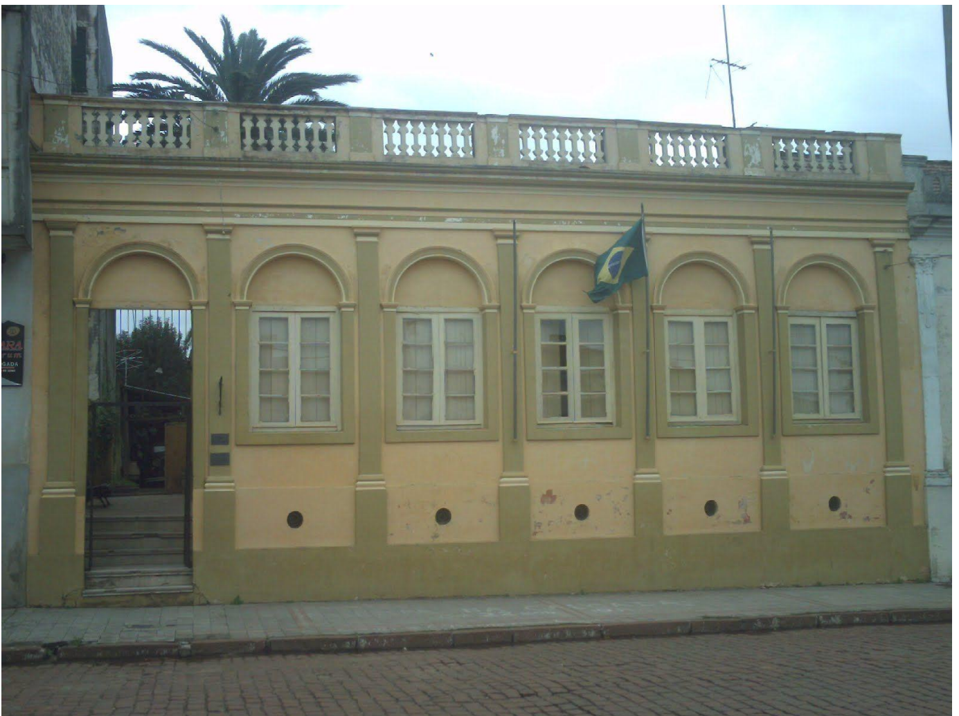
Museu Paulo Firpo

“Desde 1º de fevereiro, o museu de Dom Pedrito está apresentando “ARTEFATOS INDÍGENAS NA COLEÇÃO SEBASTIÃO DALÍSIO FREIRE e outros aportes”: Artefatos em pedra lascada e polida, cerâmicas, ilustradas com imagens e textos, compõem a exposição, montada em textura de estopa.