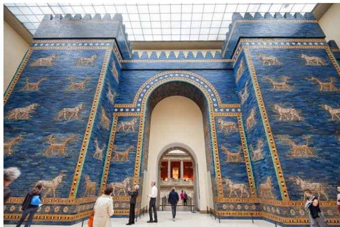
Museu Pergamon, Berlin.