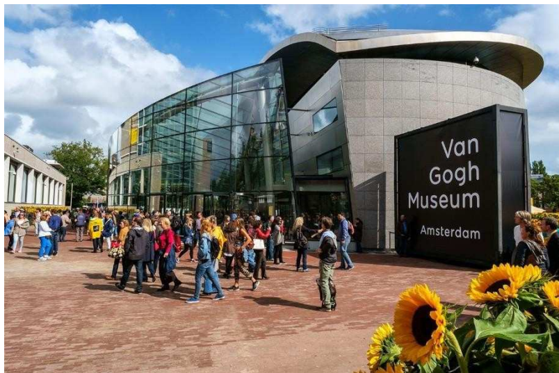
Museu Van Gogh, Amsterdam.

O Rijksmuseum, o MoMA, o Musée d'Orsay ou o museu de Van Gogh são alguns deles. É uma boa forma de aproveitar o isolamento.