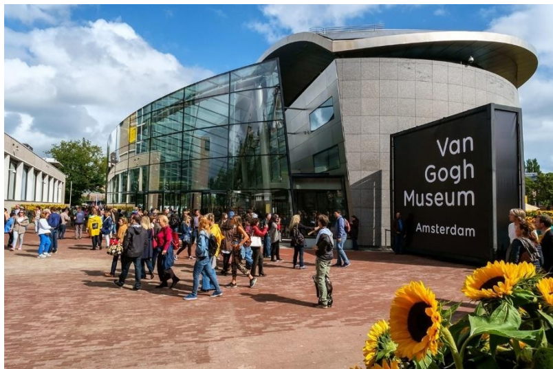
Museu Van Gogh, Amsterdam.

O Rijksmuseum, o MoMA, o Musée d'Orsay ou o museu de Van Gogh são alguns deles. É uma boa forma de aproveitar o isolamento.