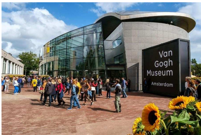
Museu Van Gogh, Amsterdam.

O Rijksmuseum, o MoMA, o Musée d'Orsay ou o museu de Van Gogh são alguns deles. É uma boa forma de aproveitar o isolamento.