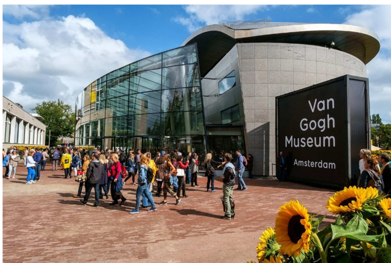
Museu Van Gogh, Amsterdam.

O Rijksmuseum, o MoMA, o Musée d'Orsay ou o museu de Van Gogh são alguns deles. É uma boa forma de aproveitar o isolamento.