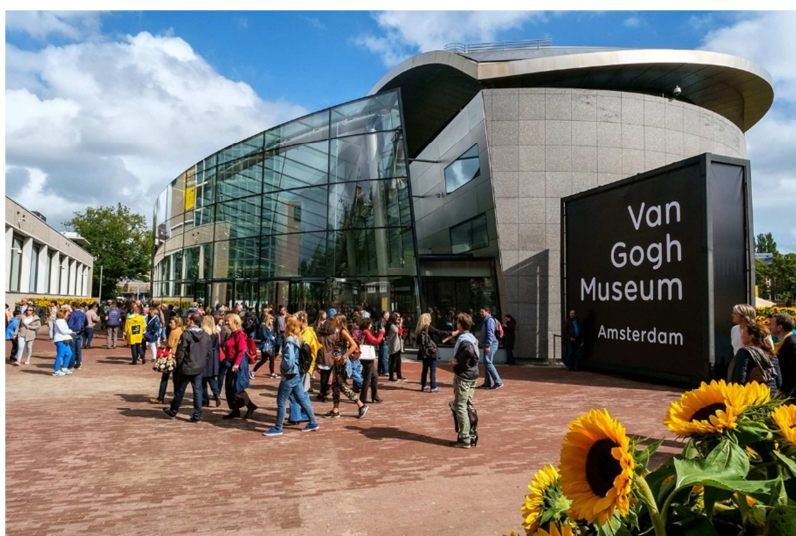
Museu Van Gogh, Amsterdam.

O Rijksmuseum, o MoMA, o Musée d'Orsay ou o museu de Van Gogh são alguns deles. É uma boa forma de aproveitar o isolamento.