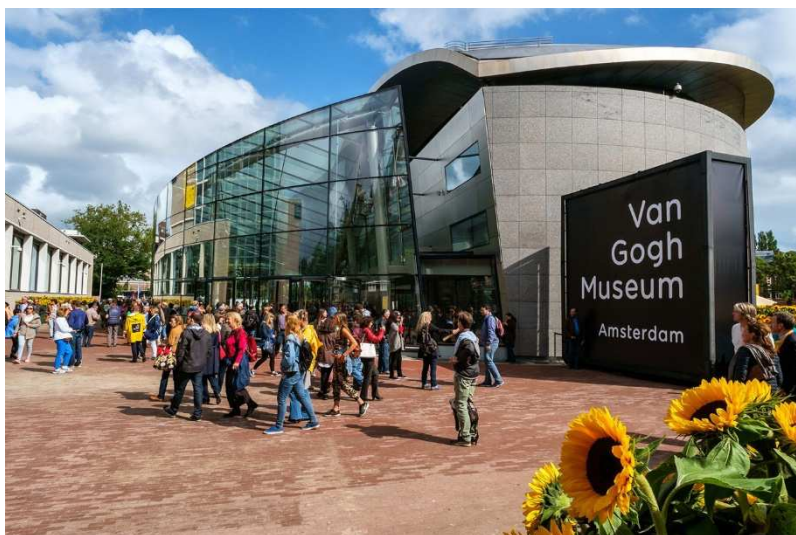
Museu Van Gogh, Amsterdam.

O Rijksmuseum, o MoMA, o Musée d'Orsay ou o museu de Van Gogh são alguns deles. É uma boa forma de aproveitar o isolamento.